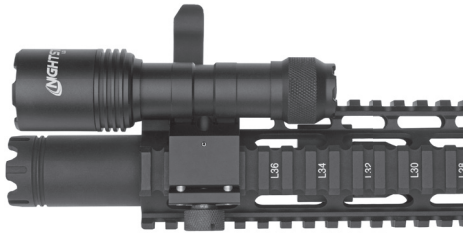
LGL-160 with Tail Cap Switch mounted on AR.