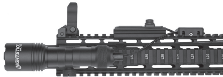
LGL-160 with Remote Pressure Switch mounted on AR using Offset Mount and Wire Management Clamp.